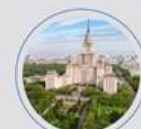
МОСКОВСКИЙ ГОСУДАРСТВЕННЫЙ УНИВЕРСИТЕТ