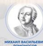
МИХАИЛ ВАСИЛЬЕВИЧ ЛОМОНОСОВ