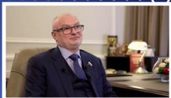
Клишас Андрей Александрович

Председатель Комитета Совета Федерации по конституционному законодательству и государственному строительству