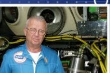
Герой России, доктор технических наук, профессор, исследователь Мирового океана