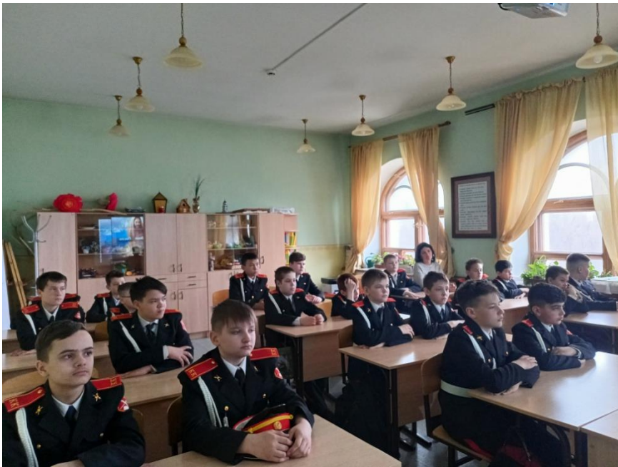
Для ребят был проведён Мастер класс «Изготовление Курицы в яйце с ее цыплятами»