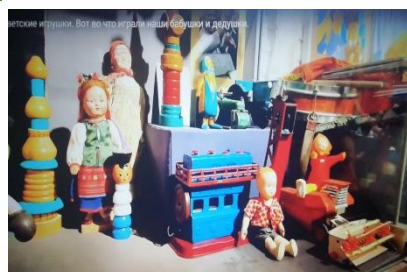
Советские игрушки. Вот что играли наши бабушки и дедушки.