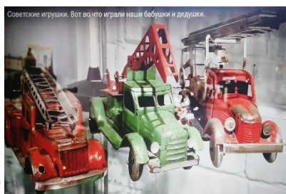
Советские игрушки. Вот что играли наши бабушки и дедушки.