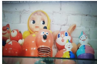
Советские игрушки. Вот что играли наши бабушки и дедушки.