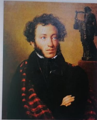
О.А. Кипренский «Портрет А.С. Пушкина»