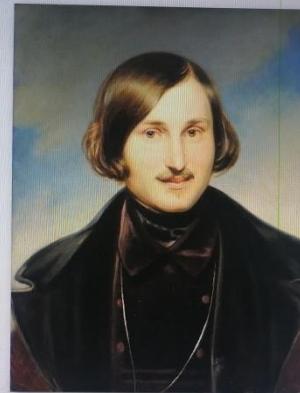
Ф.А. Моллер «Портрет Н.В. Гоголя»

Николай Гоголь со школьной скамьи зачитывался произведениями Александра Пушкина и был его преданным поклонником. Встретиться с Пушкиным Гоголю удалось только спустя два года, в 1831 году. Пушкин высоко оценил литературный талант молодого коллеги. Авторы продолжили общение, и скоро их отношения стали действительно дружескими. Пушкин подкидывал Гоголю идеи и сюжеты для новых произведений, порой хлопотал о постановке его пьес, выводил Гоголя в свет и пытался привлечь к нему внимание широкой аудитории. Сам Гоголь беспрекословно выполнял советы Пушкина, прислушивался к его мнению и «ни одну строку не писал без того, чтобы не воображал его перед собою».