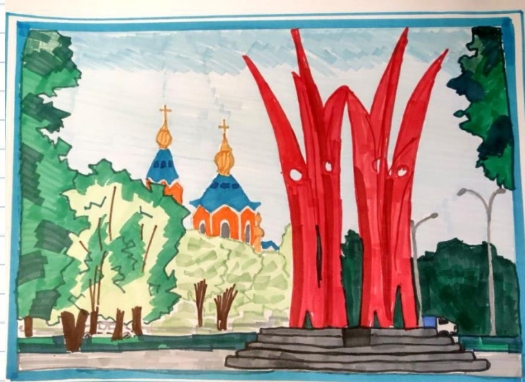
ГОРАЙЕНКО ВЕРНИКА, (КОМСОМОЛЬСК-НА-АМУРЕ, УЛ. ПЕРВОСТРОИТЕЛЕЙ 28, СКВЕР ДРУЖБЫ НАРОДОВ, ПАМЯТНИК "НЕГУШИМАЯ ДРУЖБА" (С. ЦЗЯМУСЫ)