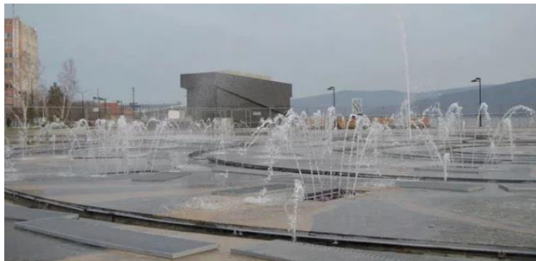
Набережная реки Амур

После виртуальной экскурсии по паркам и садам Петергофа, ребята вспомнили и рассказали о любимых местах родного города и фонтанах города Комсомольска-на-Амуре.