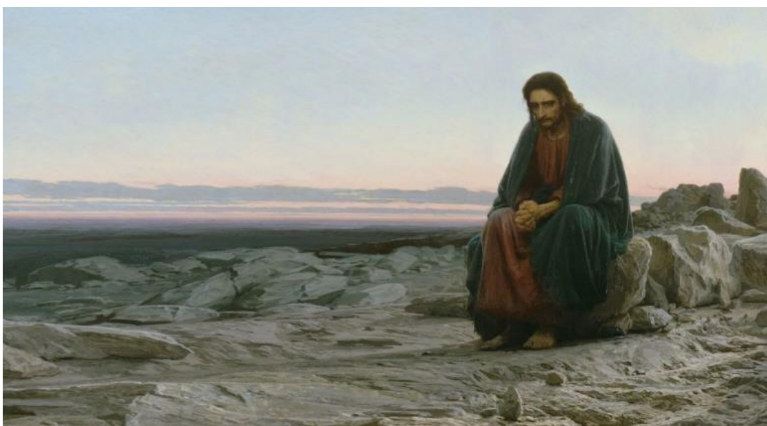
«Христос в пустыне» И.Н. Крамской