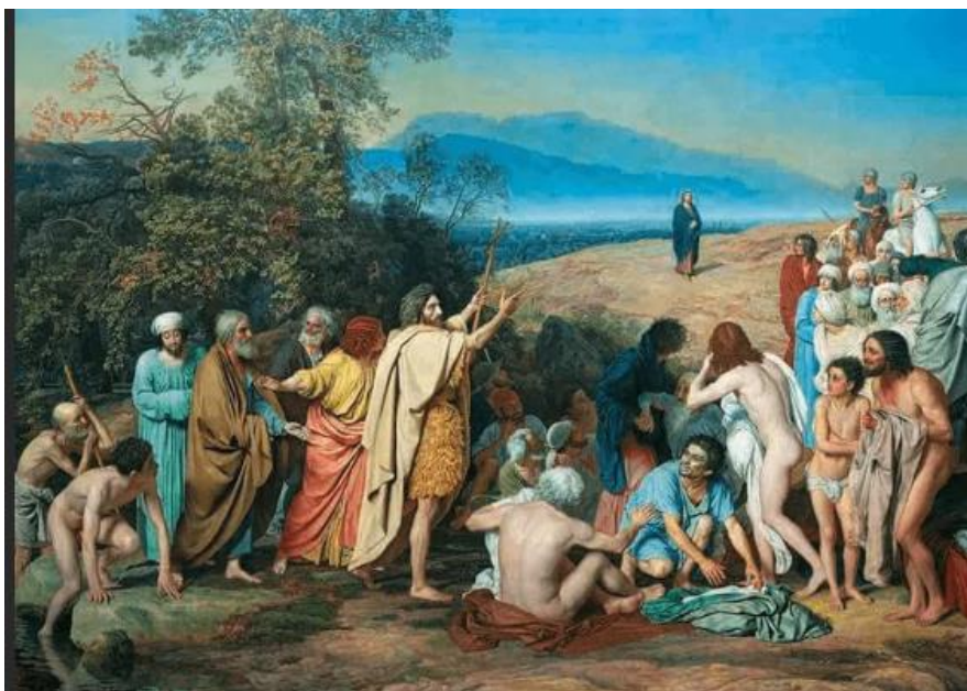
«Явление Христа народу» А.А. Иванов

Неподдельный интерес к традиции древнерусской иконописи проявлял знаменитый художник В.М. Васнецов (1848-1926), создавший блестящий ряд работ на религиозную тему, а также М.В. Нестеров (1862-1942), перу которого принадлежит множество картин религиозного содержания, в том числе на сюжеты из русской церковной истории: например, «Видение отроку Варфоломею». Васнецов и Нестеров принимали участие в росписи храмов.