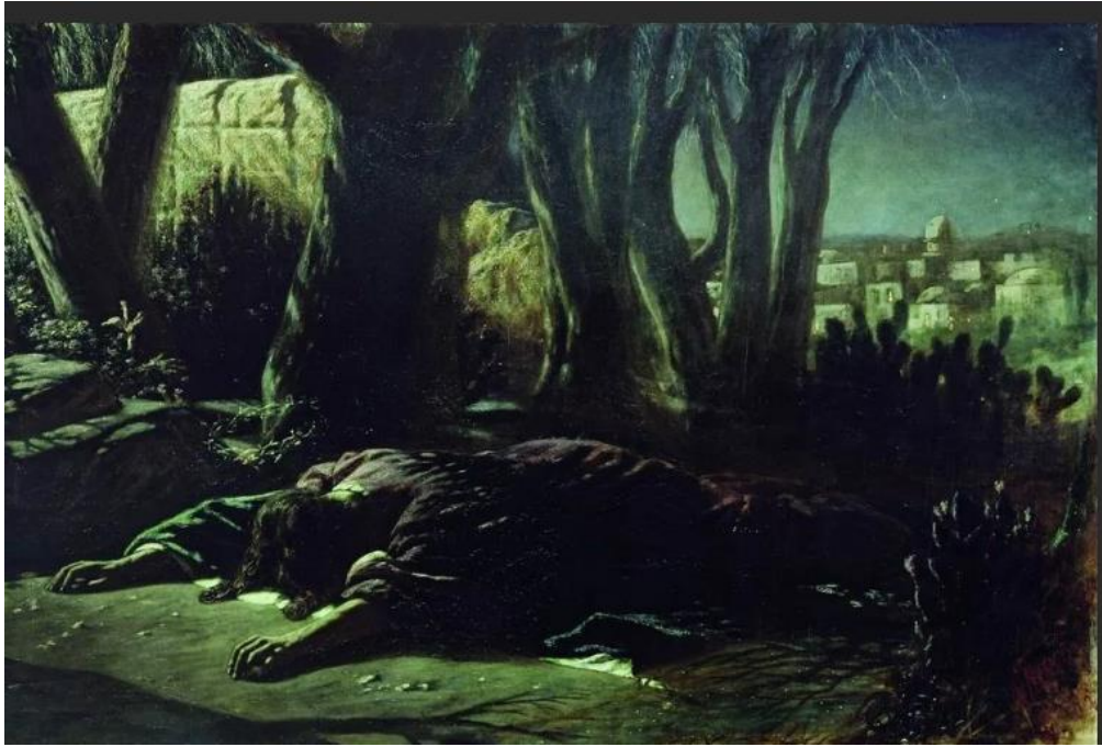
«Христос в Гефсиманском саду» В.Г. Перов

Несомненно, христианские темы, идеи, сюжеты оказали значительное влияние на все виды искусства: живопись, музыку, литературу. Создававшие наше богатое культурное наследие великие художники прошлого не мыслили творчества без служения высшим идеалам православной веры, не случайно они так часто обращались к “вечным сюжетам” Евангелия. Не всем из них духовные искания давались просто, но каждый из рассмотренных нами великих художников верно следовал в своём служении искусству идеалам добра, красоты и справедливости.