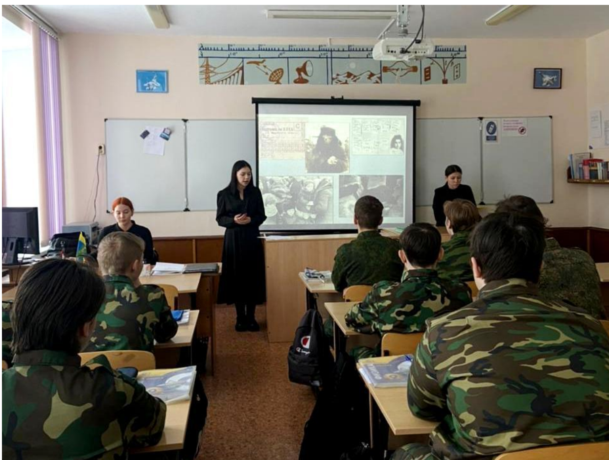
Классный час для учащихся 9К класса