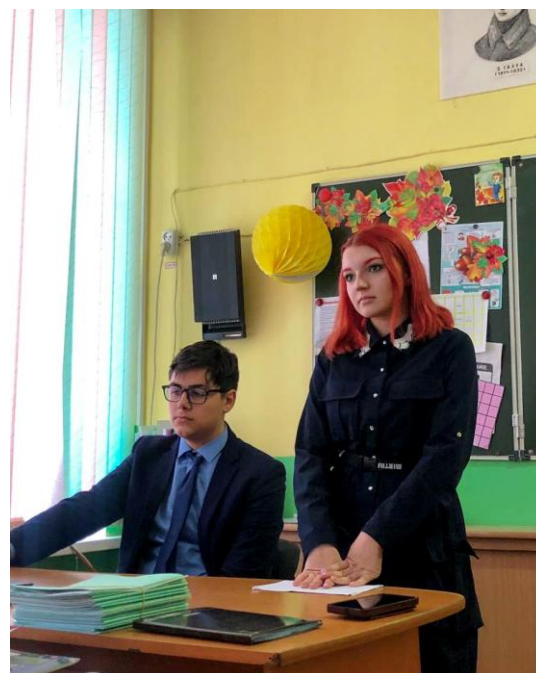
Классный час для учащихся 9Ф класса