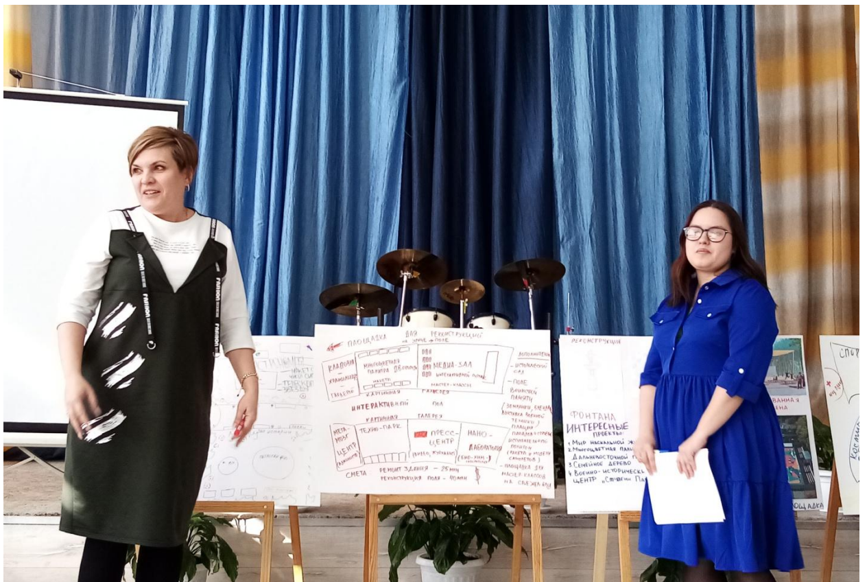
Материал подготовил Иван КОРОБОВ, корреспондент школьной газеты