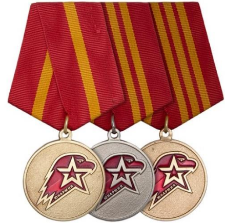
Знаки отличия юнармейцев