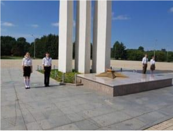
Юнармейцы возле Вечного огня