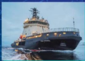
Дизель-электрический ледокол «Илья Муромец»