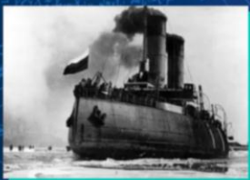
Паровой ледокол «Ермак»

Ледоколы сначала работали на паровых двигателях. Потом появились дизель-электрические ледоколы и атомные ледоколы.