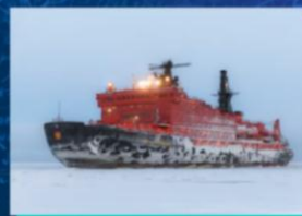
Атомный ледокол «50 лет Победы»