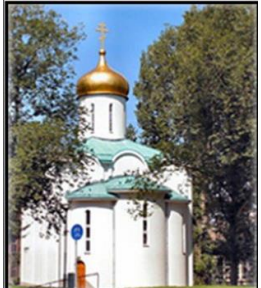
Орден Александра Невского России с 2010 г.

Храм святого благоверного Александра Невского в Роттердаме (Нидерланды)