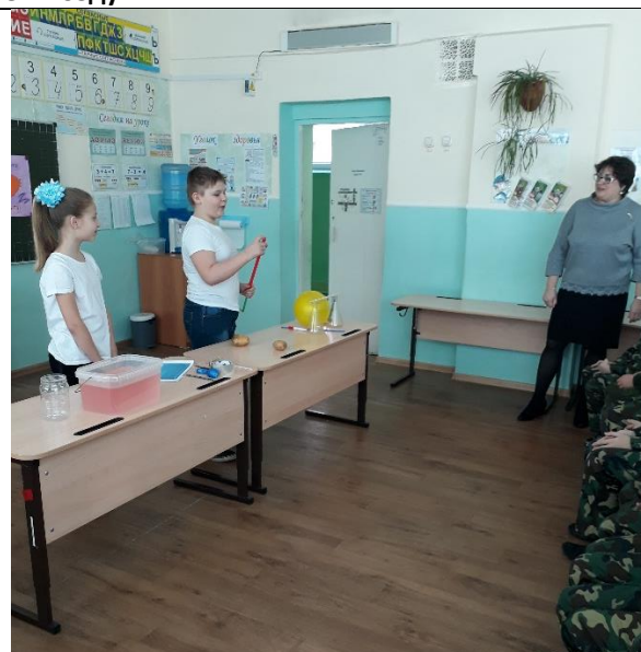
Опыт «Как сжимается воздух»