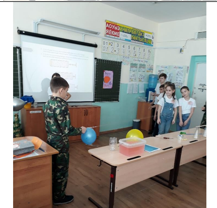
Опыт «Реактивный воздушный шарик»