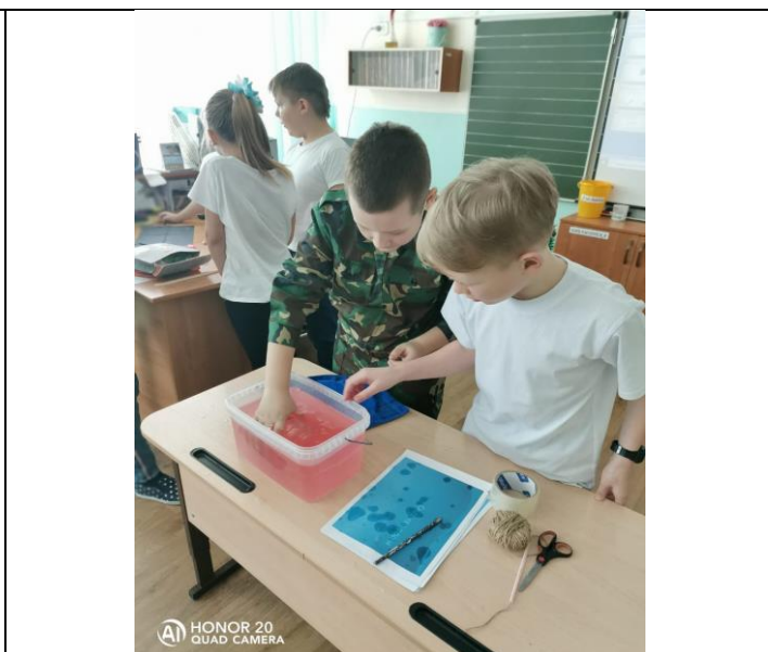
Опыт: «Сильнее воды»