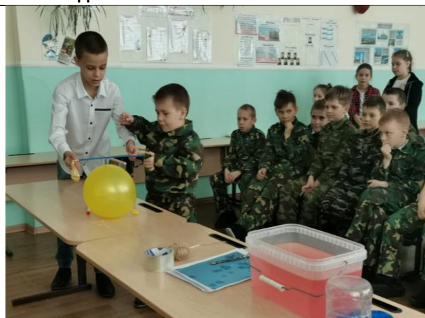
Опыт «Взвешиваем воздух»