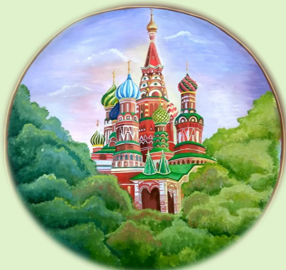
РОСПИСЬ ПО ФАРФОРУ