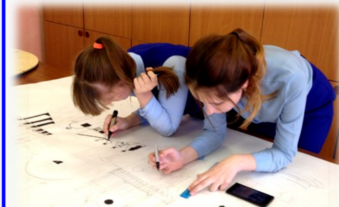
Главное — сделать расчеты