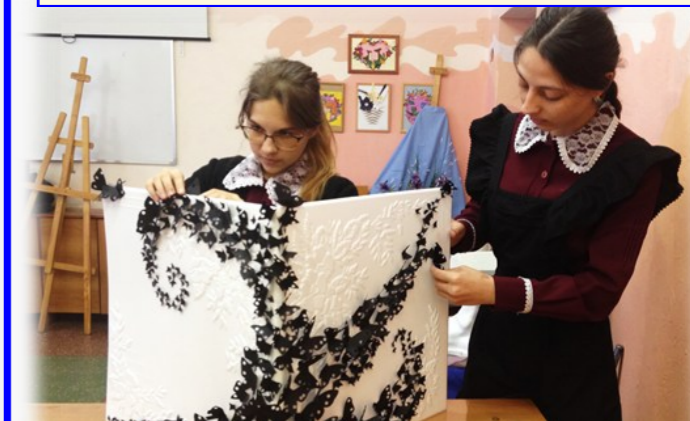
В полёте за мечтой