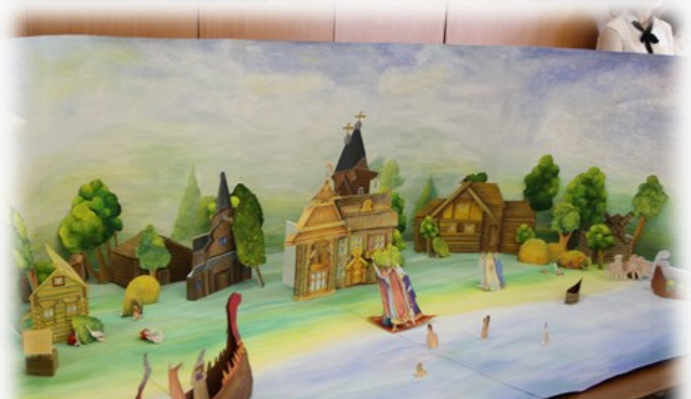
Панорама Крещения Руси