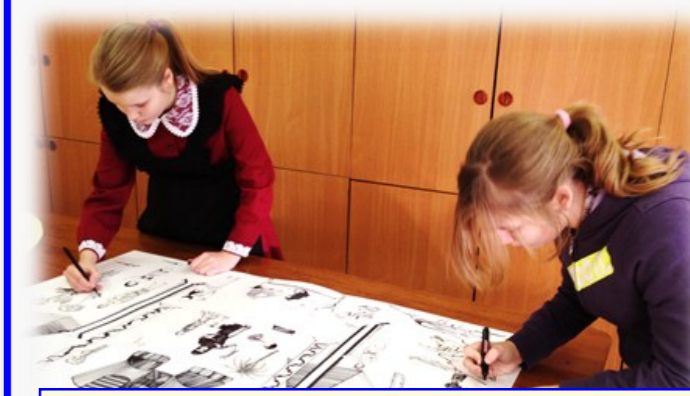
Растёт новая смена