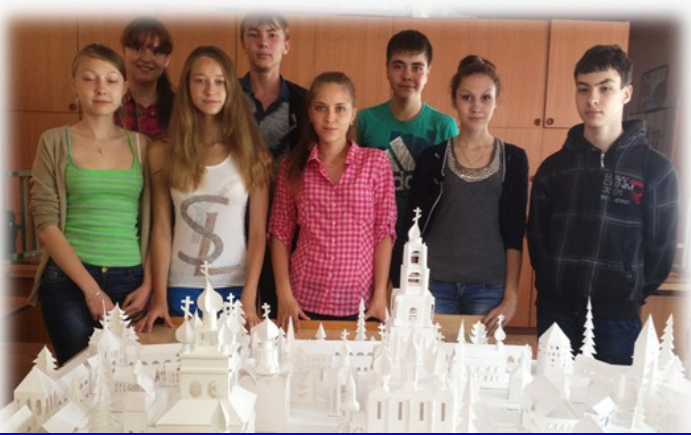
Создание макета Сергиевой лавры