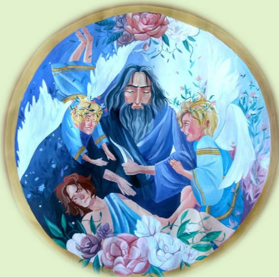
РОСПИСЬ ПО ФАРФОРУ