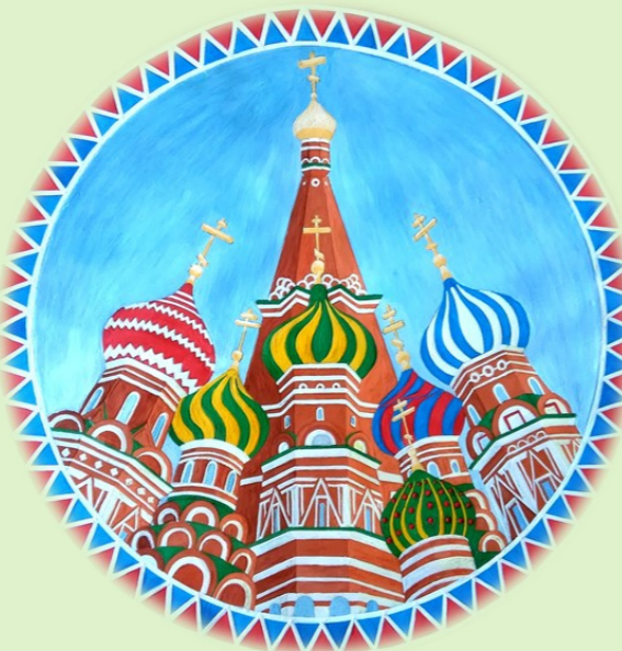
РОСПИСЬ ПО ФАРФОРУ

г.Комсомольск—на—Амуре ул. Дикопольцева, 34/5 Телефон 59-87-22