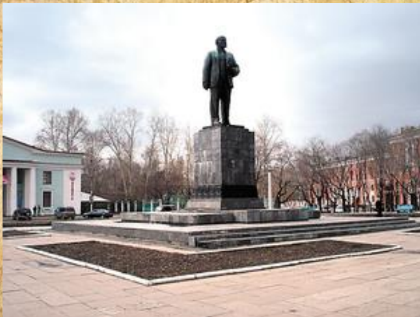
1957 Площадь им. В.И. Ленина