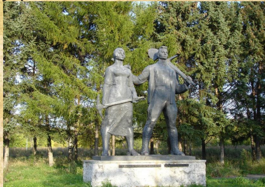
Сквер возле Дома Молодежи