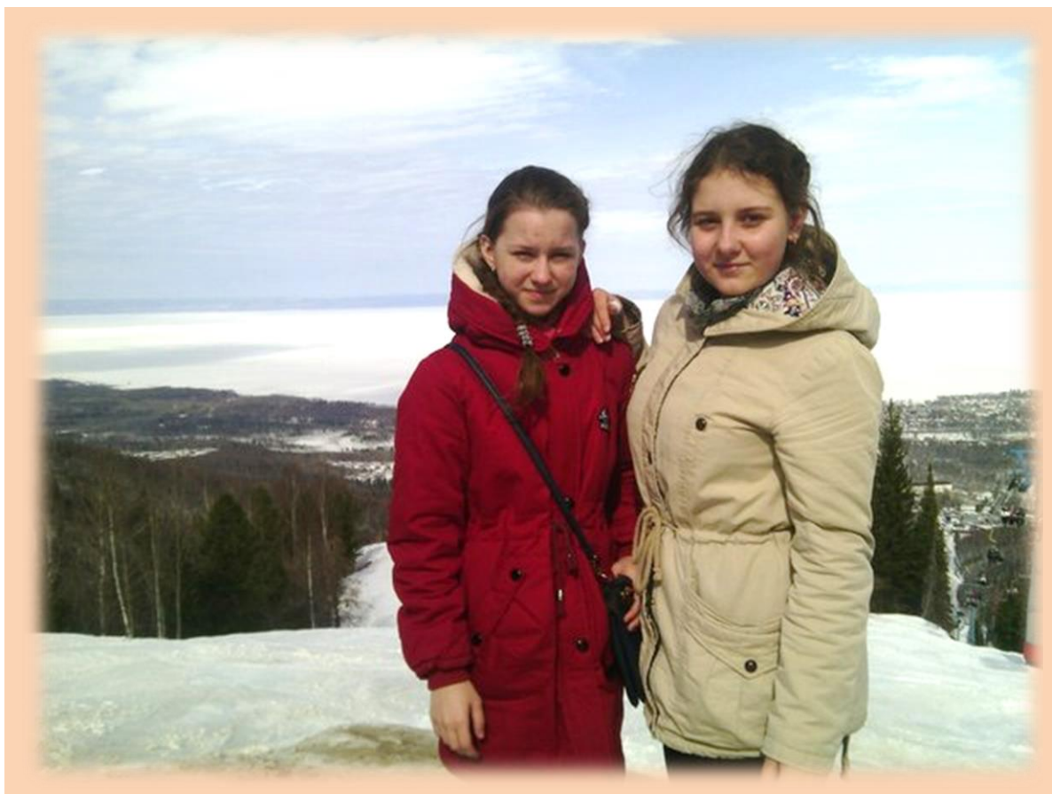
Фотография на память