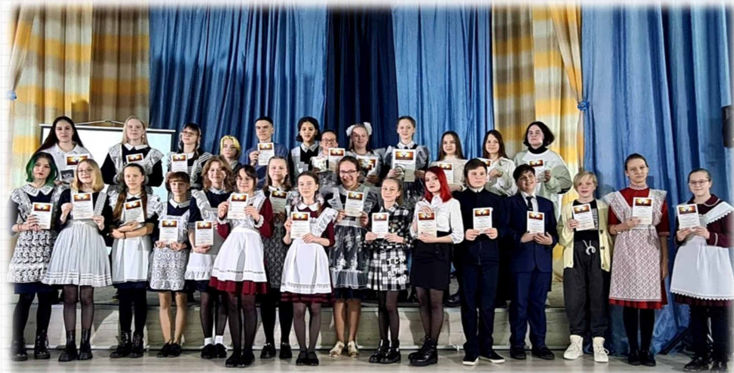
Фотография очень атмосферная и напоминает стиль старого кино.