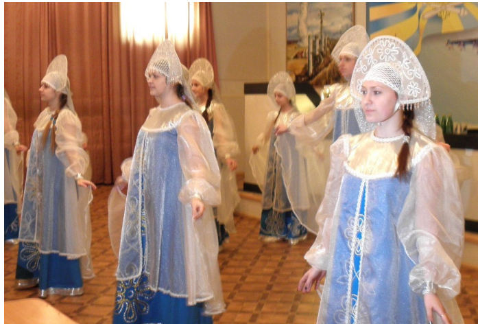
Концерт в шефской воинской части соединения ВКО дали творческие коллективы нашей школы накануне 23 февраля.