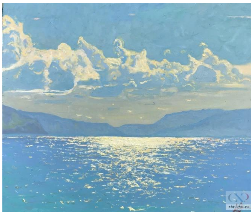
Байкал, Ласковый день, 2021 г.