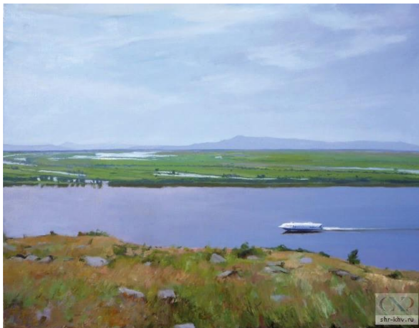
Амур у Мариинского, 2010 г.

Особенно нас привлекли наше внимание следующие картины.