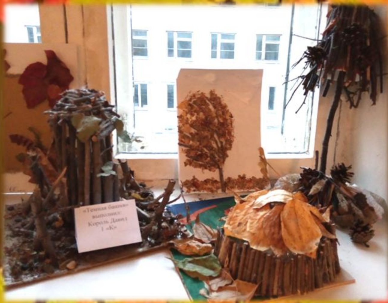
«Темная баня» выполнила Королева Дарья 1 «К»