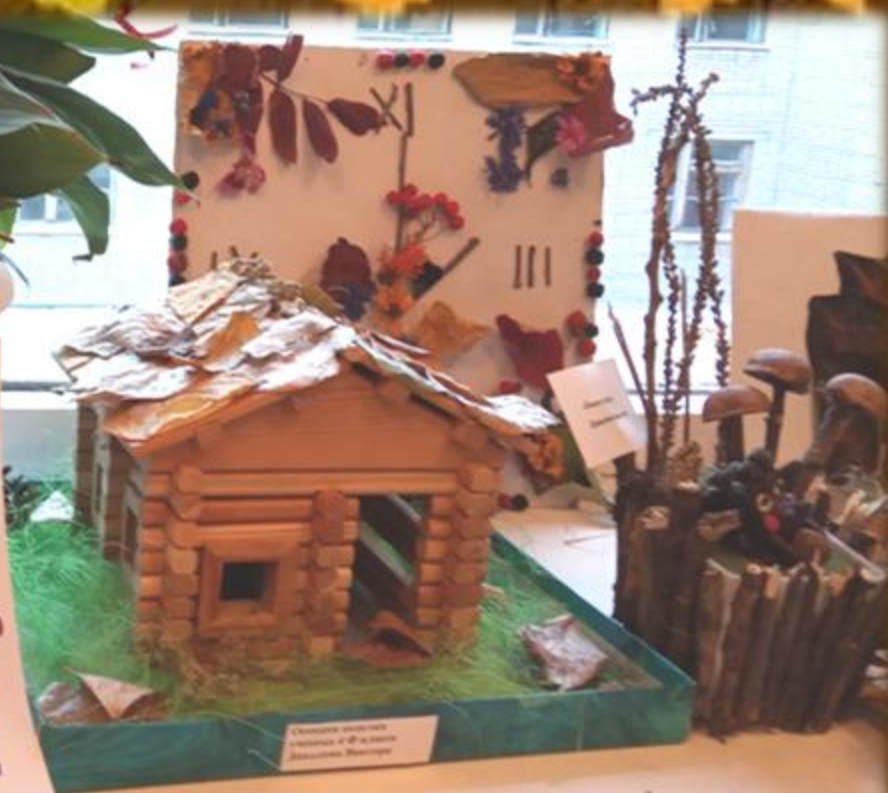
Сделано своими руками в 8-м классе Ивановской школы №1