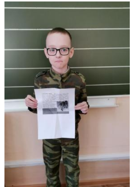
Ученики 3К класса