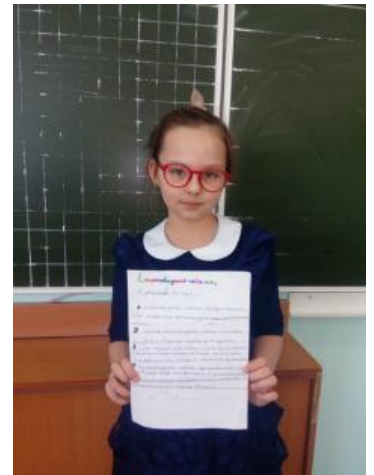
Ученики 3Ф класса