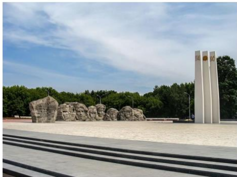
Мемориальный комплекс в г. Комсомольске-на-амуре