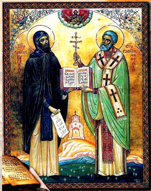
равноапостольные Кирилл и Мефодий

День славянской письменности и культуры единственный в России государственно- церковный праздник, который государственные и общественные организации проводят совместно с Русской православной церковью.