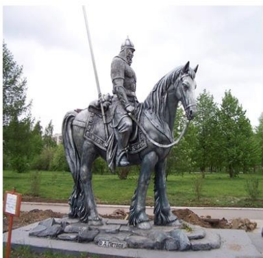
Скульптор – Федор Петров Город – Екатеринбург Скульптура «Руслан и Людмила»