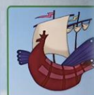
Иван и Забава Летучий корабль