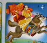
Иван Царевич Серый волк