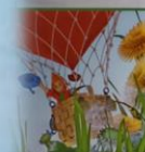
Незнайка Воздушный шар

Восстанови соответствие между сказочными персонажами и счет которых осуществлялся полёт: