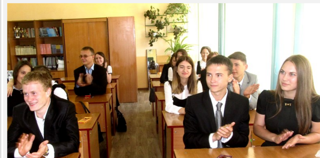
ПЕРВЫЙ РАЗ В ОДИННАДЦАТЫЙ КЛАСС