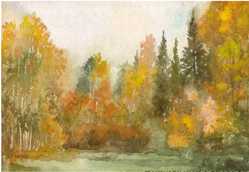
Ольга Старчеус, 10А